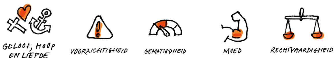
Afbeelding 2. De vijf deugden van Elckerlyc

opvangwoning €33.001. Dankzij de eigen bijdragen van cliënten en de realisatie van overige inkomsten was het gemiddeld resultaat per woning €148 per jaar. Voor een uitgebreide verantwoording van de financiën wordt verwezen naar de jaarrekening.