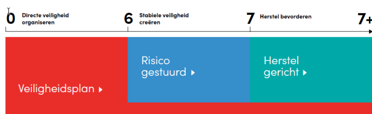
Figuur 1. Gefaseerd samenwerken aan veiligheid

Medewerkers van Elckerlyc werken volgens de visie gefaseerd samenwerken aan veiligheid.